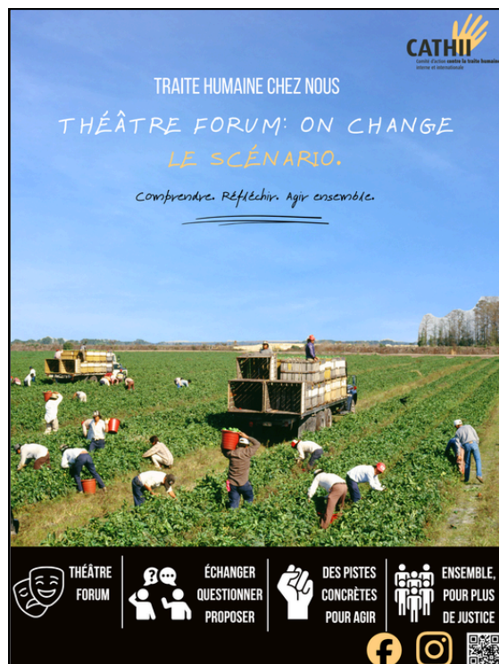
Ébauche d'une affiche promotionnelle du théâtre-forum

Le théâtre-forum est une forme de théâtre participatif qui permet au public de prendre part à la réflexion. À travers une histoire inspirée de situations réelles, les spectateurs sont invités à réagir, à échanger et à proposer des solutions. L'objectif globale du projet n'est pas seulement d'informer, mais également d'ouvrir le dialogue et de donner à chacun l'occasion de réfléchir au rôle qu'il peut jouer pour prévenir l'exploitation. Je suis convaincue que c'est en agissant ensemble que nous pouvons créer un véritable changement social.