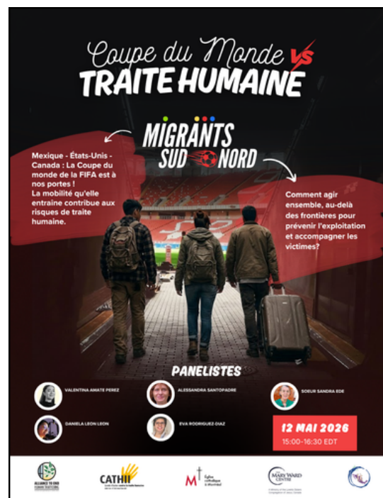
Affiche promotionnelle du webinaire